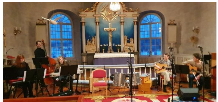
Julkonsert i Tjolöholms slottskyrka