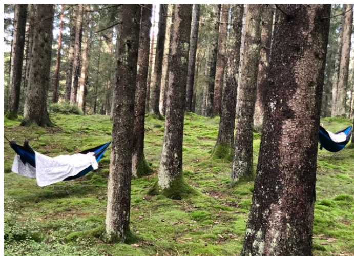
Skogsbad under nätverksträffen 2021