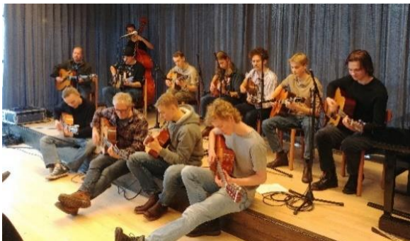
Djangomusik i Mölnlycke kulturhus

En mycket stor kvalitetshöjning har skett inom det ljudtekniska och digitala området på musiklinjen. Det är professionellt ljud på konserterna som också spelats in och flera filmklipp från dessa har lagts ut på YouTube, hemsidan och Facebook.