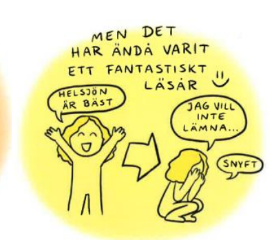
En allmänstuderande berättar i serieform om sin tid på Helsjön.

utöka möjligheten för våra studerande att träffa studie- och yrkesvägledare vid behov. När våra undervisningsgrupper har varit splittrade mellan klassrum och hemstudier har vi ibland behövt kombinera undervisning på plats med digitala möten, men detta har inte fungerat väl och är en av de saker vi framöver vill undvika. I och med att egen dator har blivit obligatoriskt för de studerande har vi goda förutsättningar att kunna dra nytta av teknikens goda sidor, och